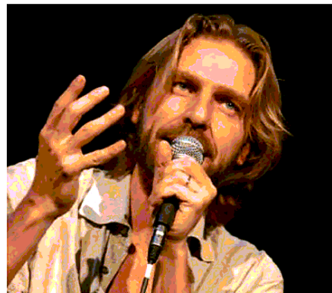
Il cantautore e attore Giulio Casale