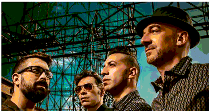
La indie-band Perturbazione, torinesi innamorati di Smiths e Belle and Sebastian

LA RASSEGNA. Da venerdì 7 a martedì 11 al parco Carrara Bottagisio